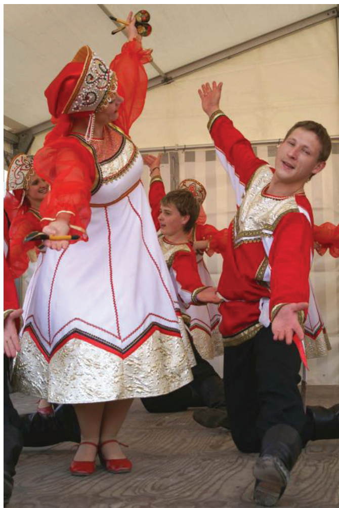
Folkloregruppe aus Wladimir beim Erlanger Frühling

2011 musste man auf den Neustädter Kirchenplatz umziehen, was der Anziehungskraft der Veranstaltung auf dem „Platz der Vereine“ keinen Abbruch tat.